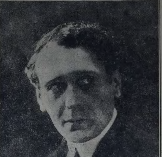
Alfredo F. Lliri, español de origen, se incorporó hace muchos años a la escena nacional, y al lado de sus más descolantes figuras consiguió forjarse un renombre envidiable.

El viernes celebrará su función de honor y beneficio Lola Membrives, repudiando "Rosas de Otoño", de Jacinto Benavente. Finalizará la velada un acto de canciones argentinas y españolas.